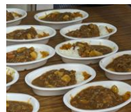
みんなと一緒にカレーライス