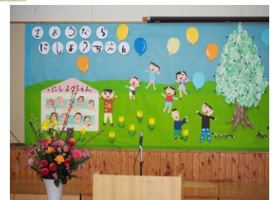
楽しかった幼稚園の様子を絵に

子どもの減少に伴い、中津川・南・西の3つの幼稚園が令和6年度から統合され、南幼稚園を「中津川幼稚園」として名前を変えて新しい園がスタート。(西幼稚園園児数 18人 R6/3現在)