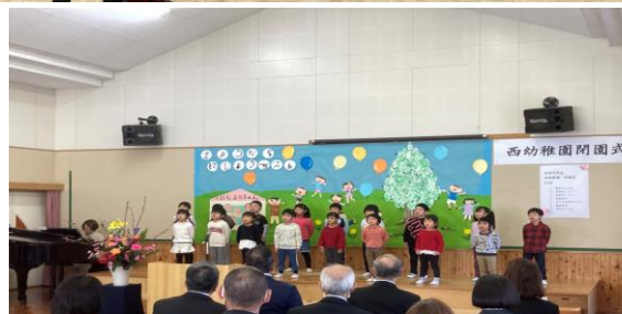
園児のみんなが元気よく歌を披露