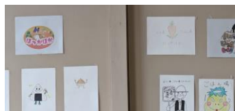
中津商業高校生のイラスト